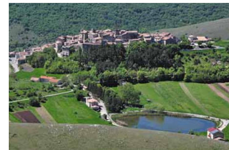
Santo Stefano di Sessanio.

From the centre of Santo Stefano di Sessanio we take the road for Campo Imperatore. After about 1km (signpost), we turn right onto a side street and then take a lane crossing a plateau (Piano Lucchiano). From here we climb up a valley (Valle Pareta) as far as a road halfway up the slope (3.5km from the start). Following it to the right and keeping to the right, we reach a fork and go up to the Renaissance oratory of Madonna della Pietà, a small chapel built in the sixteenth–seventeenth century. The place of worship has an octagonal floor plan and a dome with eight segments. Inside we find a painting of Our Lady of Miracles and a sculpture of Saint Michael with Arms. From here, we can head towards the village of Rocca Calascio, largely abandoned, (another 350m, then turn right) or we can climb to the fortress by bearing right. The fortress (1380), which can be visited free of charge, was used as a military observation point in communication with other nearby castles, as far as the Adriatic Sea. It is in white ashlar and consists of a keep, a crenellated wall, and four corner towers. The path ends in the parking area at the entrance to the village of Rocca Calascio. At this point, we can go back to Santo Stefano di Sessanio along the same route. To visit the charming town of Calascio (around 3km away) we follow the winding road downhill to the town. From here we can return to Santo Stefano by bus (see timetable).