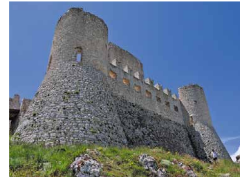
Il castello di Roccalascio. Roccalascio castle.

Da qui, è possibile proseguire per l'abitato di Rocca Calascio, in buona parte abbandonato (ancora 350 m e poi girare a destra), oppure salire alla fortezza piegando a destra. Il castello (1380), visitabile gratuitamente, era utilizzato come punto d'osservazione militare in comunicazione con altri castelli vicini, sino all'Adriatico. Costruito in pietra bianca a conci squadrate, si compone di un mastio centrale, di una cerchia muraria merlata e quattro torri d'angolo. Il percorso termina nell'area parcheggio all'imbocco del centro abitato di Rocca Calascio. A questo punto, si torna a Santo Stefano di Sessanio per lo stesso percorso. Per chi volesse visitare il suggestivo centro storico di Calascio (circa 3 km di distanza) si segue la strada a tornanti in discesa, fino al centro abitato. Da qui si può tornare a Santo Stefano in bus (vedi orari sul posto).