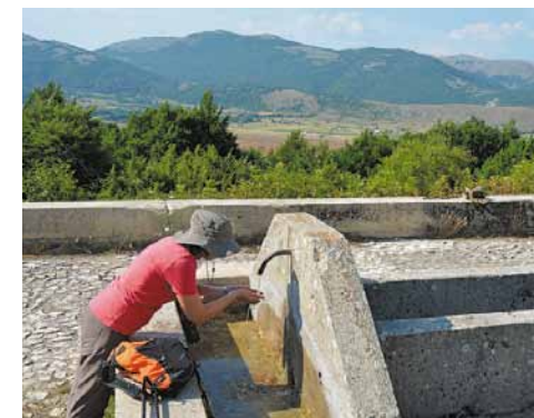
Fonte Calabritto. Sullo sfondo i Piani di Cascina. Calabritto fountain. The Piani di Cascina landscape.

Piani di Cascina, a preferred destination for nature lovers, is a karst plateau about 8km long and 4km wide, at just over 1,000m, along the northern slopes of the Mount Calvo and Mount Giano group.