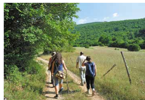
Lungo il percorso. Along the trail.

Alla fine del sentiero, sulla destra, troviamo Fonte Calabritto, meta della nostra passeggiata: fontana usata in passato come abbeveratoio per gli animali. La sua posizione è privilegiata e ci permette di osservare l'affascinante paesaggio dei Piani di Cascina con l'anfiteatro montano dei Monti Cagno e Gabbia. Il ritorno è sul medesimo tragitto.