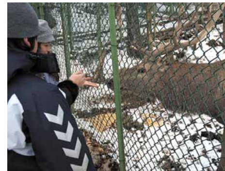
Incontro ravvicinato. Close encounter.

Da piazza largo Fontana, nei pressi del municipio, ci si tiene a destra per imboccare via Canale in direzione sud; dopo 100 metri, si gira a destra e si raggiunge l'ingresso del Museo dell'Orso che merita senz'altro una visita. Il Museo è interamente dedicato al simbolo del Parco: l'orso bruno marsicano e, all'interno, grazie a bacheche, diorami e filmati, sono illustrate la vita e le abitudini del celebre plantigrado.