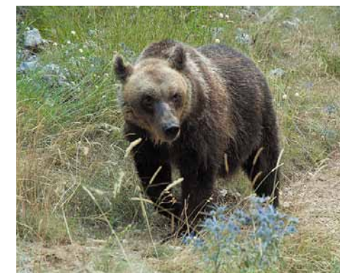
Uno degli orsi presenti nel recinto. One of the bears in the enclosure.

At the end of the descent, we turn left and continue along the stony path that runs alongside the bear wildlife area, which is the best observation point for the two animals (4). Then we find the deer area again (5) and once the two wildlife folds are behind us, we cross a meadow and follow a cart-road to the left, reaching a dirt track (Via Aia Canale) (6), following it back to the starting point.